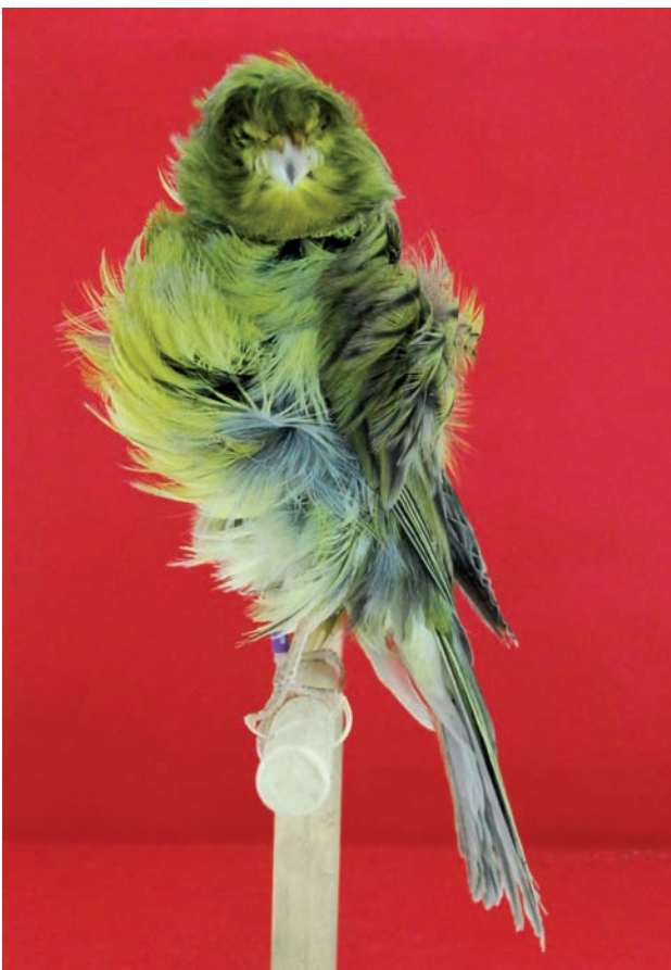
Campeón de España C.O.E. 2009. 93 puntos.