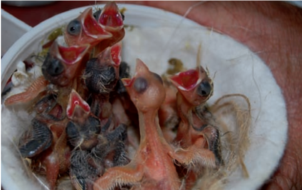
Primeros Rizados de Paris del año, a la espera de poner dos polluelos a sus respectivas nodrizas.